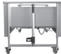
Beispiel Front von PB 321

Die Lenkrollen des Pflegebettes sind mit einer Bremse versehen. Die Bremse blockiert die Roll- und Lenkbewegung der Lenkrolle.