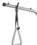
Aufrichterende mit Triangel