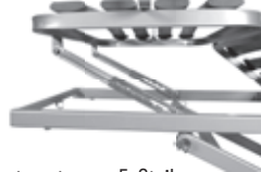
Rastomaten am Fußteil

Der an der Fußseite der Liegefläche montierte Rastomat (1) ermöglicht das Stufenweise Absenken des Fußteils der Liegefläche.