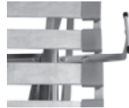
Matratzenhalter an Liegefläche

Die Liegefläche ist 4-fach geteilt. Das Kopfteil ist um 70°, die Unterschenkelverstellung bis 20° verstellbar. Die Holzleisten der Liegefläche sind abwischbar und mit Kunststoffhaltern am Rahmen befestigt. Die Matratze wird durch 4 Matratzenhalter sicher auf der Liegefläche gehalten.