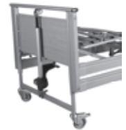
Front 326 mit Hubmotor